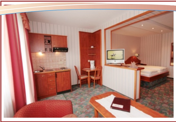
Doppelzimmer Kategorie A - Premium