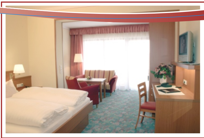
Doppelzimmer Kategorie B - Superior