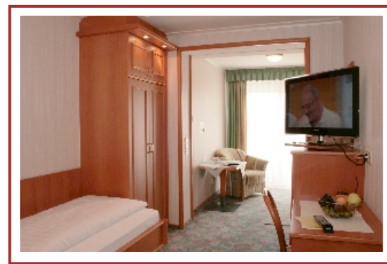
Einbettzimmer - Deluxe