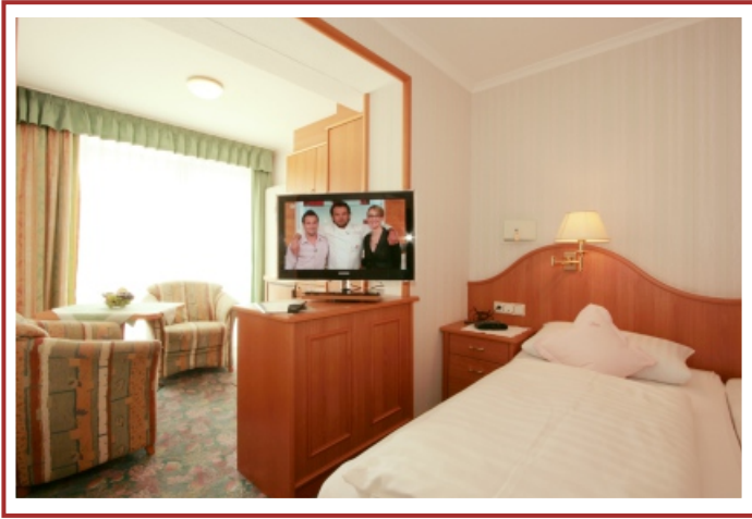
Doppelzimmer Kategorie A2 - Deluxe