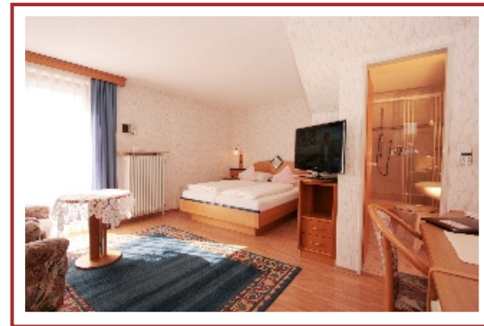
Doppelzimmer Kategorie 2 - Standard

Die Zimmer dieser Kategorie sind unterschiedlich gestaltet und können vom Bild abweichen.