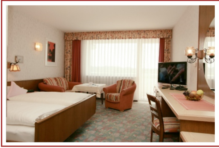
Doppelzimmer Kategorie 1 - Komfort